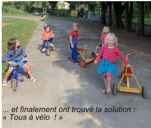
... et finalement ont trouvé la solution : « Tous à vélo ! »